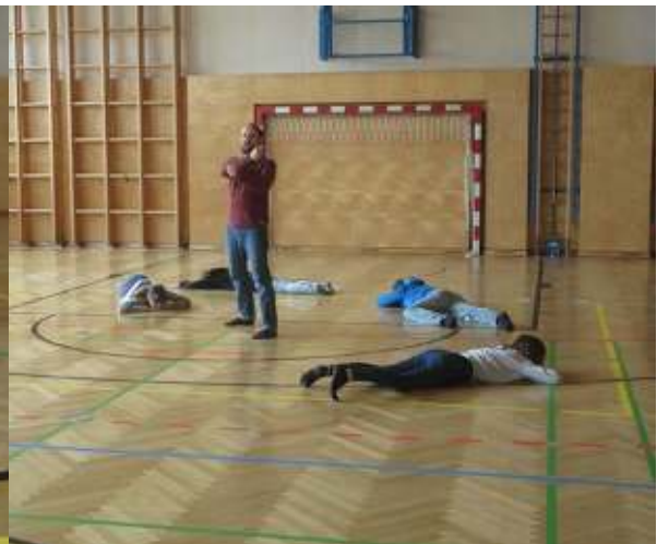
Sieg - Zgaga - Vittoria - Victory