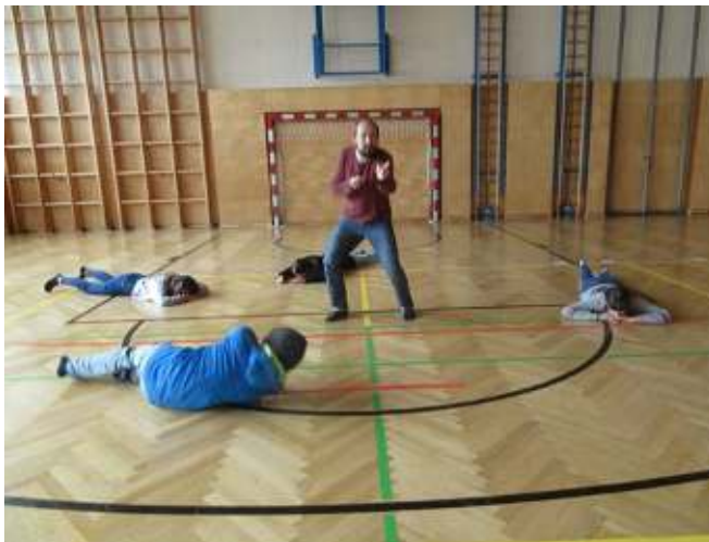
Zmaga - Krieg - Guerra - War