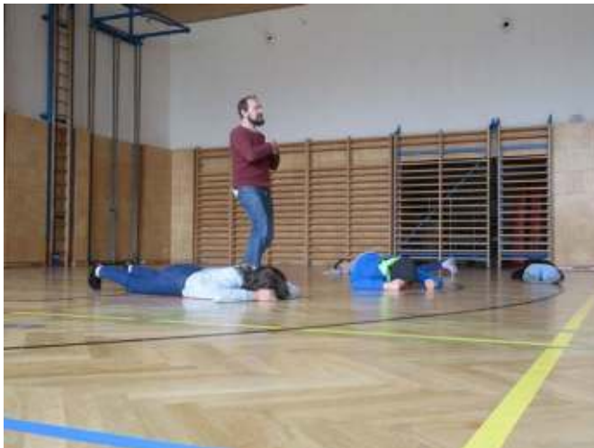
Friede - Mir - Peace - Love