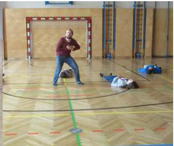
Liebe - Pir - Love - Amore

19.Mai 2021, 10.00 MESZ / May 19th 2021, 10.00 CEST